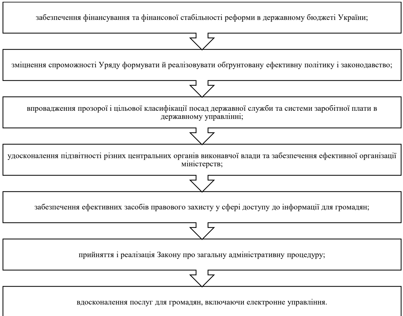
Рисунок 3.3 – Основні пріоритети розвитку публічного управління в Україні

За результатами проведеного дослідження з урахуванням європейського досвіду щодо розвитку якості публічного управління було визначено основні пріоритети розвитку публічного управління в Україні. Результати представлені на рисунку 3.3.