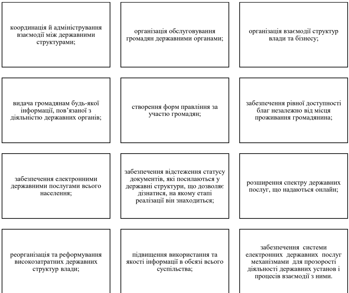
Рисунок 3.4 – Основні завдання розвитку електронних державних послуг як пріоритетного напрямку публічного управління в Україні

У контексті перспектив запровадження європейського досвіду розвитку органів публічної влади в Україні варто також визначити функціонування системи електронних державних послуг як одну з провідних тенденцій розвитку якості публічного управління. Основні завдання системи електронних державних послуг представлені на рисунку 3.4.