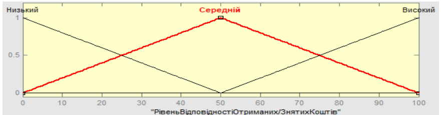
Рисунок 2 – Функції належності вхідної лінгвістичної змінної x_2 “Рівень відповідності отриманих і знятих з рахунку коштів”