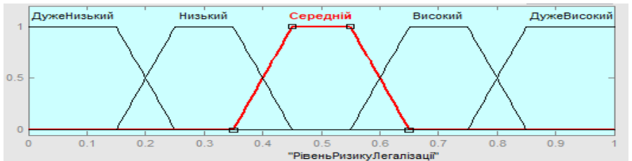
Рисунок 3 – Функції належності вихідної лінгвістичної змінної y “Рівень ризику легалізації кримінальних доходів”