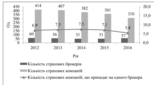
Рис. 3. Співвідношення кількості страхових компаній та страхових брокерів на страховому ринку України за 2012–2016 рр., од.

Загалом економічна діяльність страхових агентів і брокерів приносить приблизно 0,6% від загального обсягу ВВП Європейського союзу. Внесок страхового посередництва у ВВП національних економік країн ЄС помітно відрізняється, що пов'язано з відмінностями в обсягах національних страхових ринків та відносної важливості каналу страхового посередництва в кожній країні. Найбільшу частку страхове