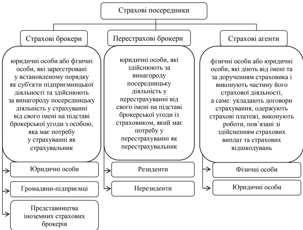
Рис. 1. Сутність та класифікація страхових посередників на страховому ринку України

У країнах Європи і США більша частина страхових договорів укладається за посередництва страхового брокера. Так, у Великобританії число таких угод сягає 70%, а в США становить не менше 80% від усіх укладених договорів. Водночас в Україні частка страхових платежів, що акумулюється брокерами в загальному обсязі надходжень страхових премій, становить близько 4 % страхового ринку.