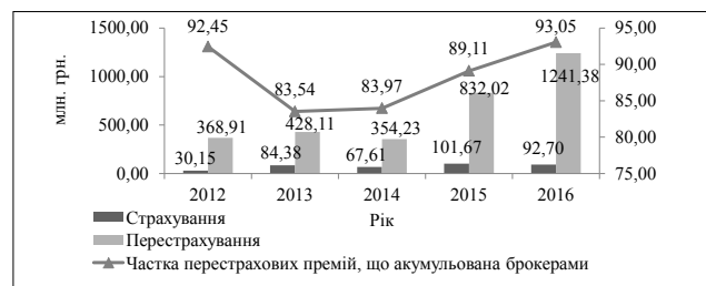
Рис. 4. Динаміка обсягу страхових премій в Україні, що зібрані страховими брокерами за 2012–2016 рр., млн. грн.