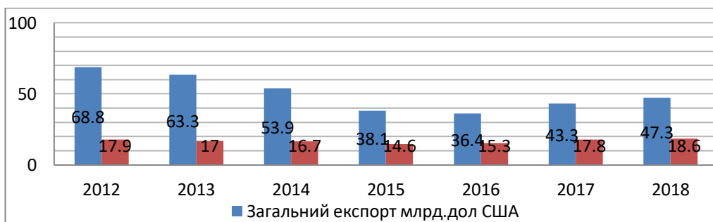
Діаграма 2.1–Порівняльна динаміка експорту з України протягом 2012-2018 років [8].

Експортна динаміка АПК показала аналогічний тренд як і решта експортних товарів, але швидкість зменшення експорту АПК був меншим від загального і, не звертаючи уваги на зниження після кризових 2012-2013 років, зростання обсягу поставок було помітне вже в 2016 році. Історично рекордний обсяг експорту АПК відбувся в 2012 році, він склав приблизно 18,9 млрд дол. США. Однак даний показник було перевершено – за результатами 2018 року було реалізовано закордон агропродовольчої продукції на 18,6 млрд дол США. Отже, за останні 10 років експорт агропродовольчої продукції з України виріс вдвічі.