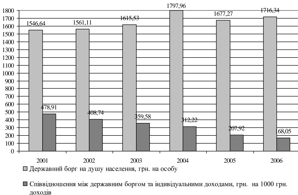
Рис. 3. Державний борг на душу населення та його співвідношення з індивідуальними доходами населення у 2001-2006 рр.

Протягом останніх років, величина державного боргу на душу населення коливається у межах 1500-1800 грн. (рис. 3).