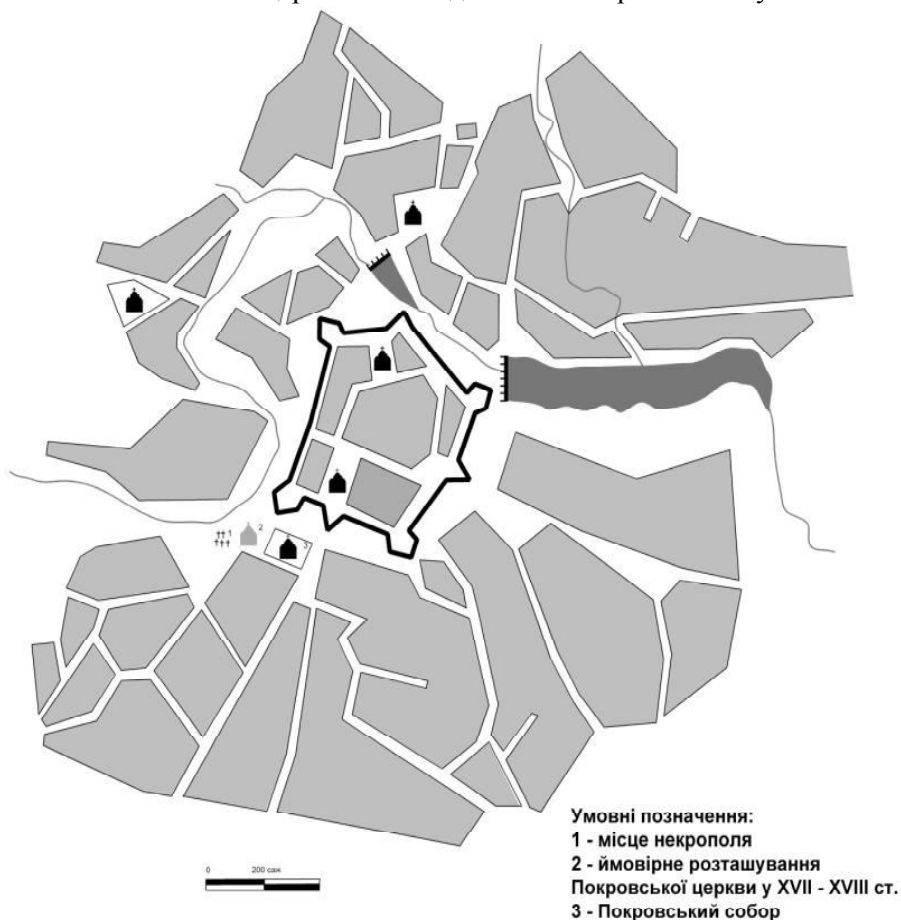
Рис. 2. Місце розташування некрополя та Покровської церкви на плані м. Охтирка 1786 р.

Виявлені поховання є рештками прицерковного некрополя посаду міста Охтирка. Він знаходився одразу ж за еспланадою, на південь від фортеці. Тут сходяться дві важливі дороги, що вели у місто з Котельви та Зінькова ( див. рис. 2 ). У цьому місці у другій половині XVII ст. існувала дерев'яна церква Покрови Пресвятої Богородиці. В.В. Вечерський її будівництво відносить до 1654 р., тобто часу заснування Охтирки [2, с. 396]. Архієпископ Філарет наводить дані документу, датованого 1677 р., де згадується священник Святопокровської церкви [4, с. 263]. Отже, у другій половині XVII ст. церква на посаді міста Охтирка вже існувала.