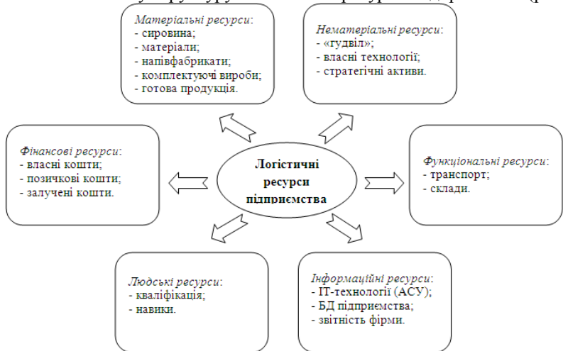
Рисунок 2 – Авторський підхід щодо виділення логістичних ресурсів на підприємстві

Однак, вказані вище види логістичних ресурсів, на нашу думку, не дають змогу комплексно їх оцінити, що створює певні бар'єри для формування ефективної системи розподілу промислових підприємств. Так, авторами запропоновано власну структуру логістичних ресурсів підприємства (рис. 2).