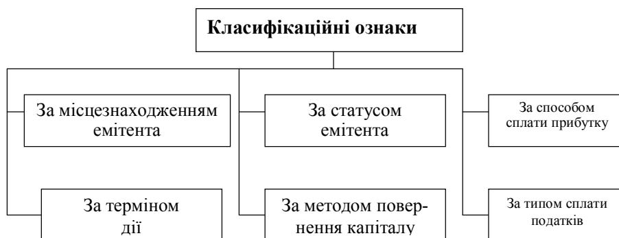
Рис. 3. Ознаки класифікації облігацій [16, с. 37]

Не менш важливим інструментом фінансового ринку є облігації. Наведена їх класифікація (рис. 3) базується на практиці фондового ринку Німеччини.