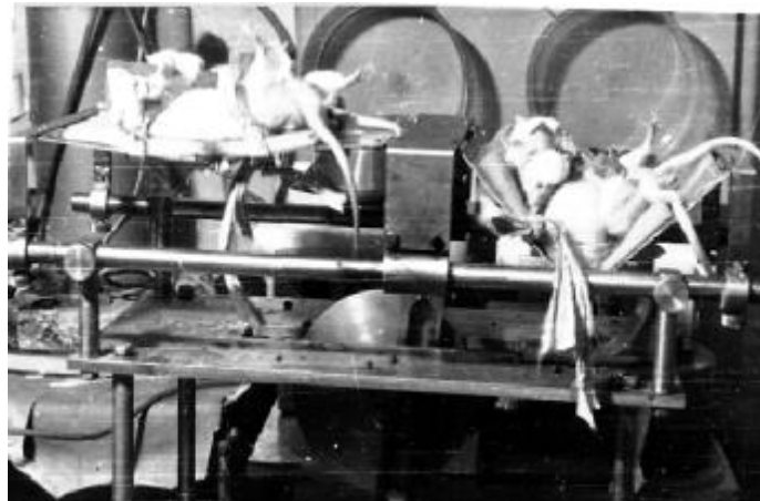
Рисунок 2 - Дослідження впливу гіперкінезії на опорно-руховий апарат щурів