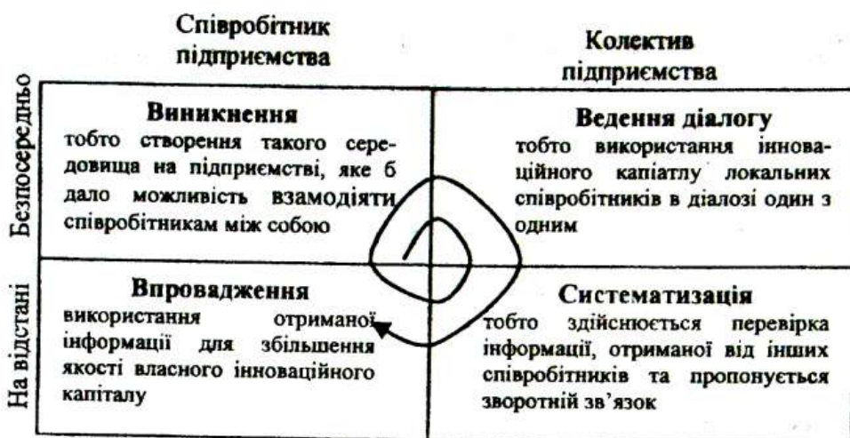
Рисунок 2 – Процес обміну інноваційним капіталом між співробітниками підприємства