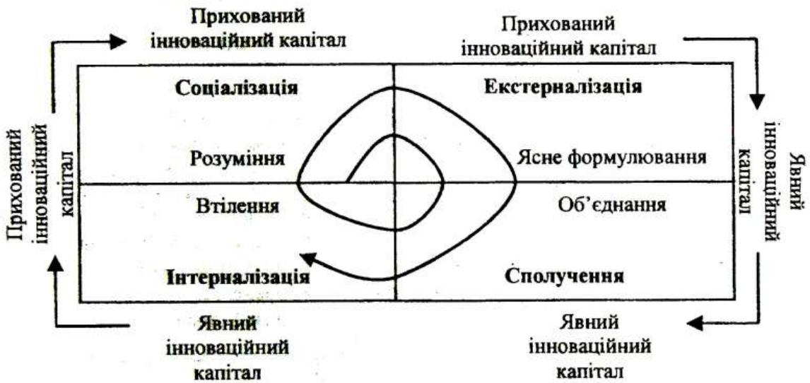
Рисунок 1 – Формування інноваційного капіталу у окремого співробітника

Розглянемо більш детально перший етап (рис.1).